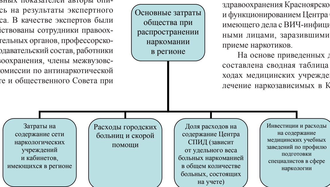
Рис. 1. Основные затраты общества при распространении наркомании в регионе

На основе приведенных данных составлена сводная таблица о расходах медицинских учреждений на лечение наркозависимых в Красно-