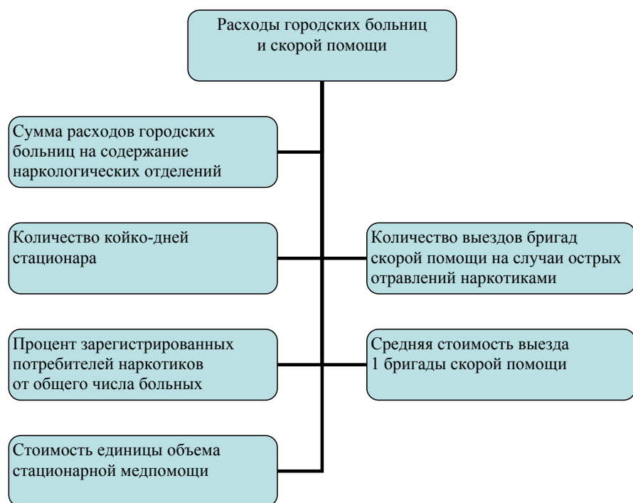
Рис. 3. Структура расходов региональных медучреждений при распространении наркомании

ярском крае (см. таблицу). Рассчитаны показатели наглядности по отношению к 2005 г. (абсолютные данные этого года приняты за 100%).